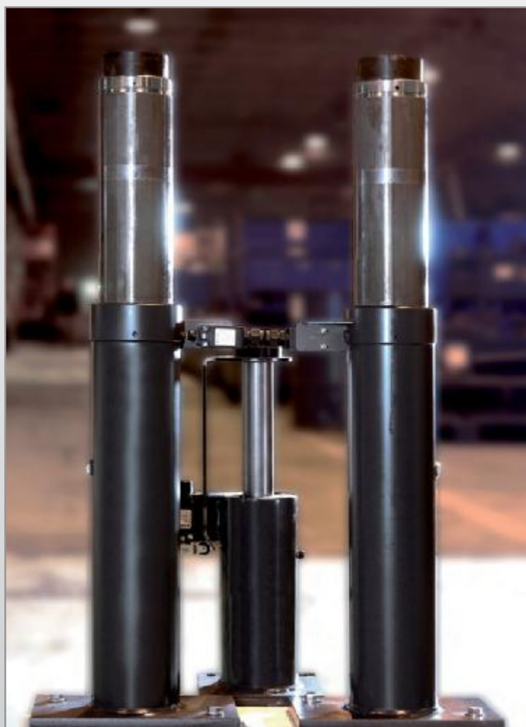
ГИДРАВЛИЧЕСКИЕ БУФЕРЫ ДЛЯ ЛИФТОВ